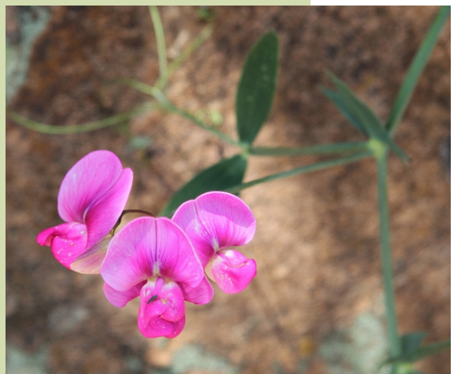
Lathyrus latifolius . Esta leguminosa gabeadora só se atopa nas zonas de clima mediterráneo.