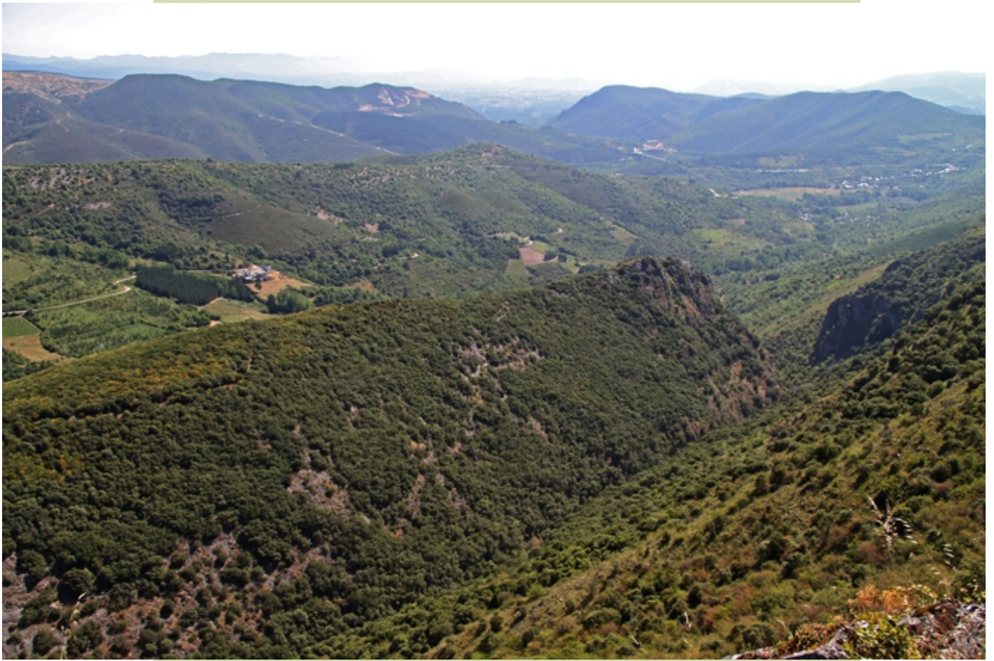
Vista desde o Mirador do Penedón cara ao Leste