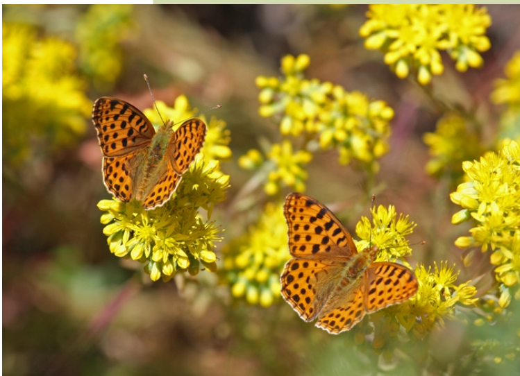
Issoria lathonia sobre flores de sedum