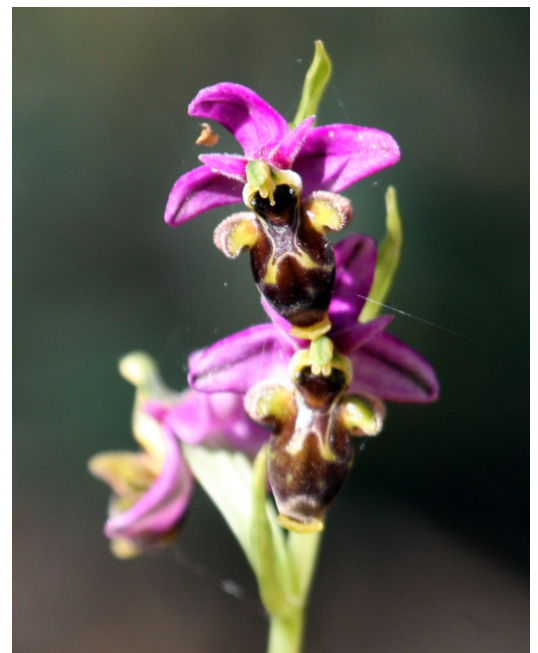
Ophrys scolopax . En Enciña da Lastra atópanse 25 especies de orquídeas, a maior variedade de Galicia.