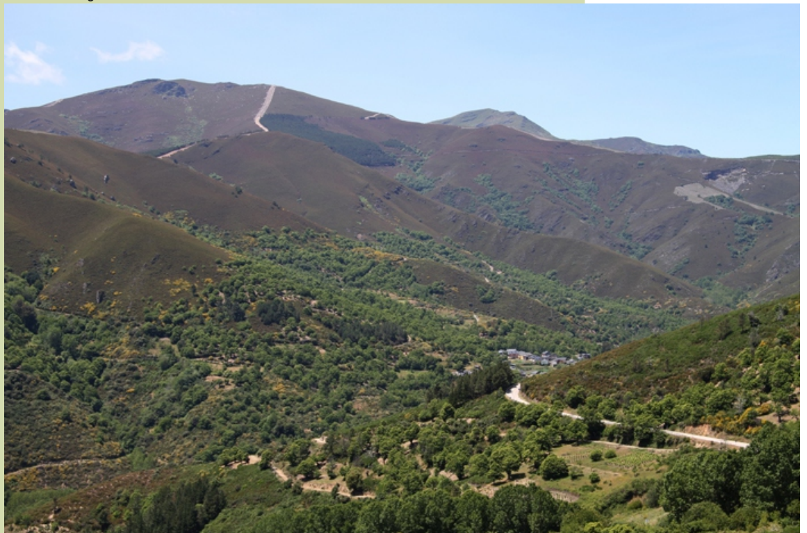
Oulego e a serra da Agulla desde a Cruz do Lamazal