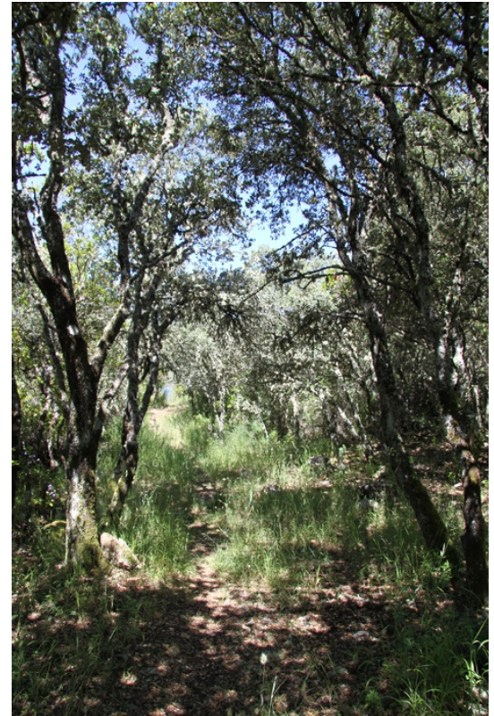
A ruta polo interior do aciñeiral

Subimos ao miradoiro do Penedón, desde onde se pode ver a outra banda da serra e o comezo do canón do Sil no Estreito. Volvemos un pouco atrás e collemos un carreiro que atravesa polo bosque de aciñeiras e vai saír ao camiño de Biobra a Oulego. Continuamos ata achegarnos o máis posible aos Penedos de Oulego, seguindo os camiños de arriba, e alí damos volta para regresar a Biobra, polo mesmo camiño ou por outro de máis abaixo.