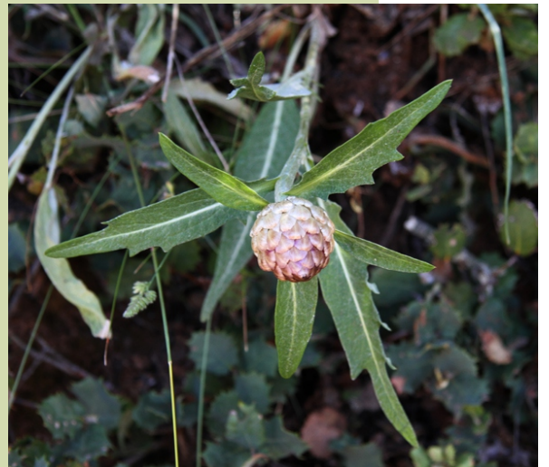
Leuzea conifera . Ten o seu límite de distribución nas calcarias de Valdeorras.