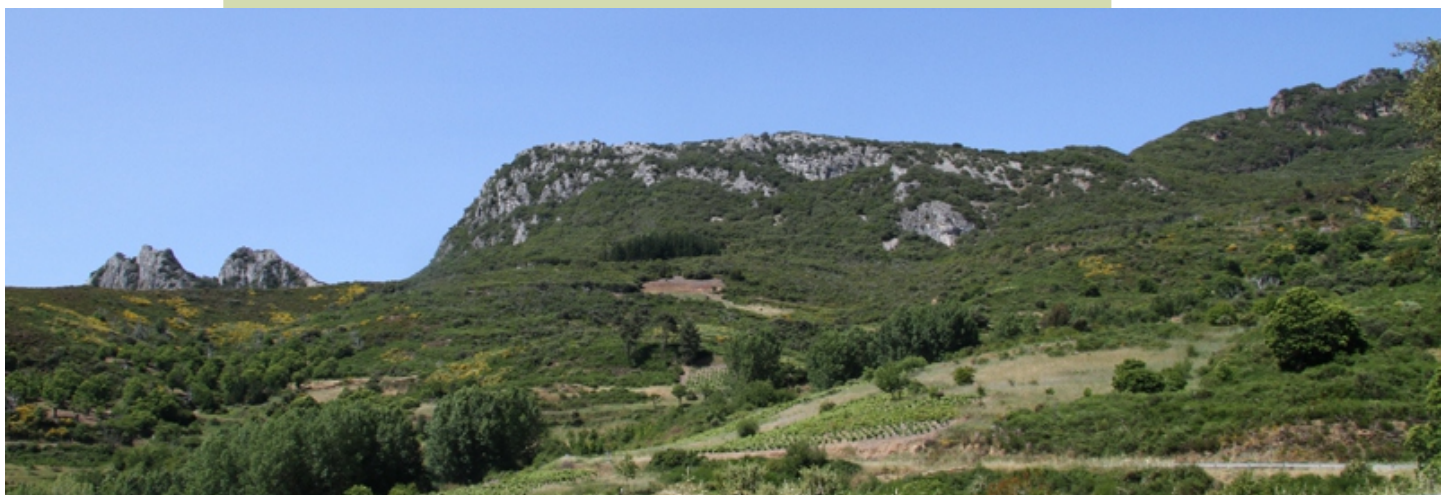
Os Penedos desde O Real, no camiño de Rubiá a Biobra