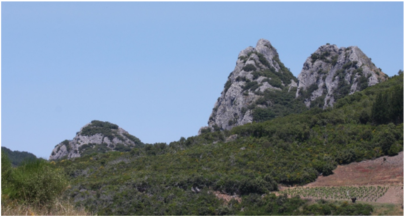
Penedos de Oulego desde a Cruz do Lamazal