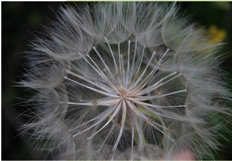
Froitos de Tragopogon unha planta que medra á beira dos camiños e só abre as flores pola mañá